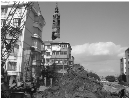
图4 全套管冲抓咬合桩临近建筑物施工

咬合桩部分施工段临近小区居民楼房,由于全套管施工在成孔和灌注两个阶段均是钢套管护壁,因此施工中对临近建筑物地基基础无扰动,冲抓为干式成孔无泥浆污染,施工过程中噪声和震动小,符合环保要求,不扰民。咬合桩施工现场如图4所示。