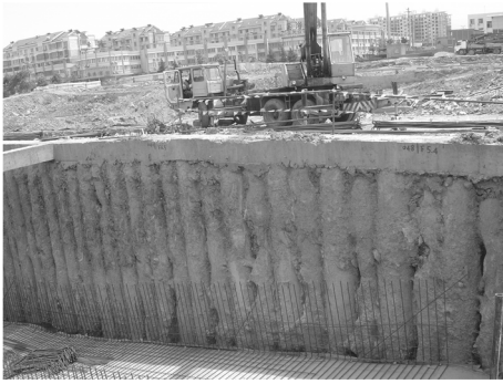
图3 咬合桩开挖后的断面