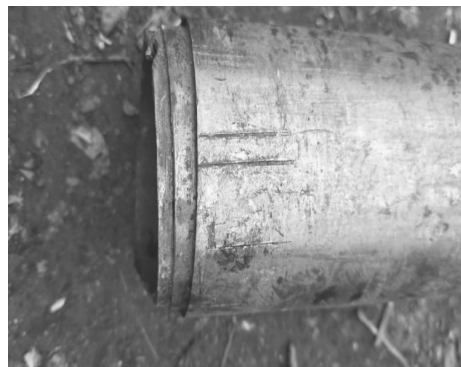
图3 断裂的扩孔器 Fig.3 Broken reaming shell

(3)200~500 m多处有多层构造带,其中3处比较厚,最厚一层达22.02 m,中间含有绿泥石等水敏性成分,吸水膨胀,造成钻孔缩径严重。构造带岩心如图5所示。