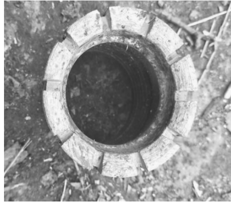
图1 内口磨损的金刚石钻头 Fig.1 Diamond bit with inside wear

(2)在83.75~335.6 m多层涌水,194 m以浅涌水严重,水可以从孔口冒出,对冲洗液造成破坏,导致护壁困难,掉块严重,引发事故,如图3、图4所示。