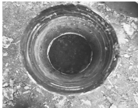
图2 磨损的钻杆接手 Fig.2 Wear of drill pipe adapter