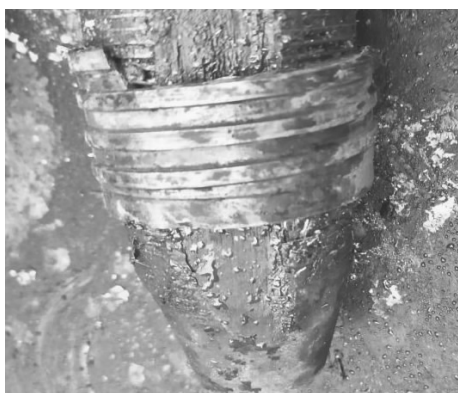
图 4 断裂的钻杆接手